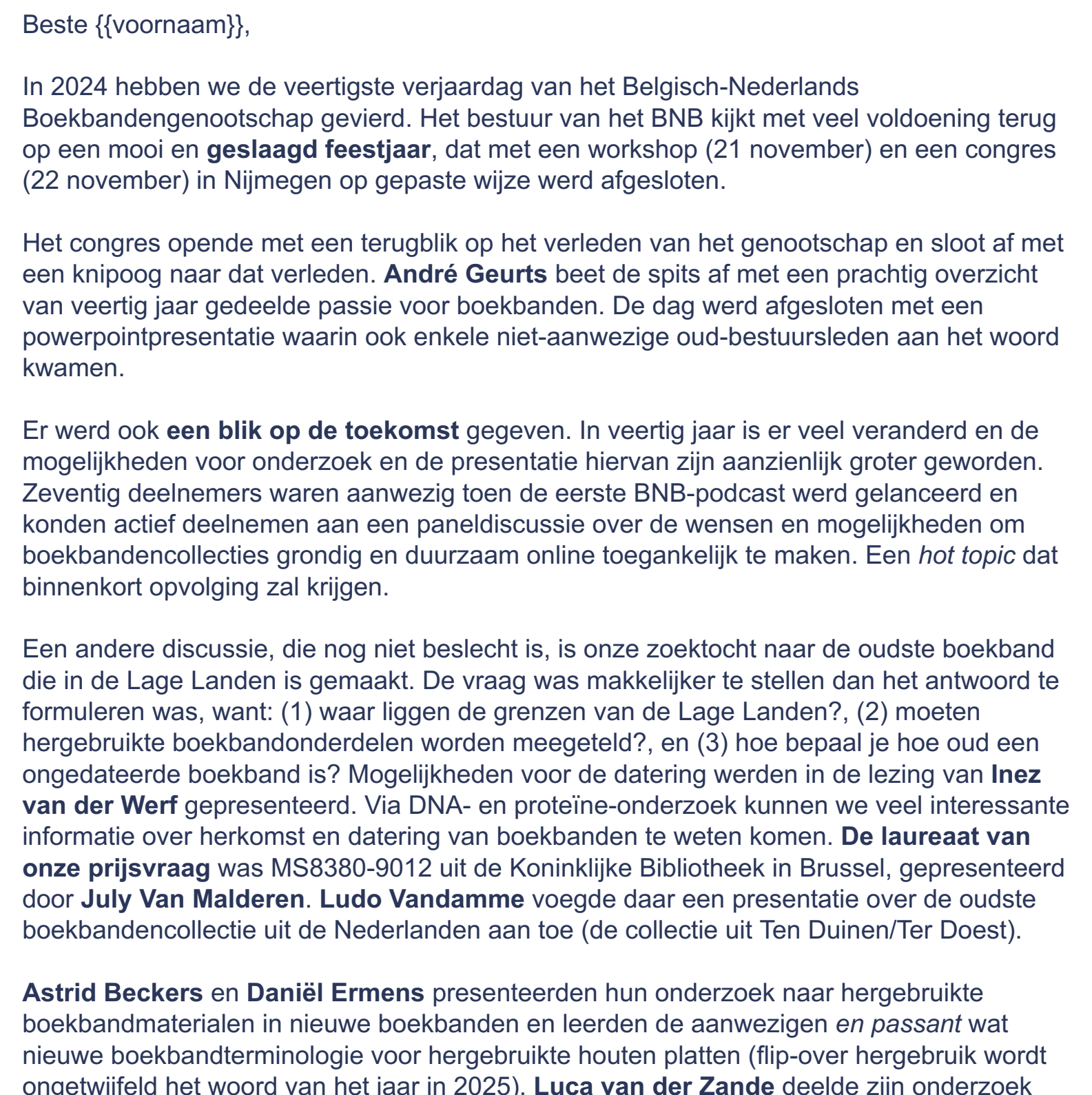
Het veertigjarig jubileumcongres in Nijmegen, 22 november 2024.