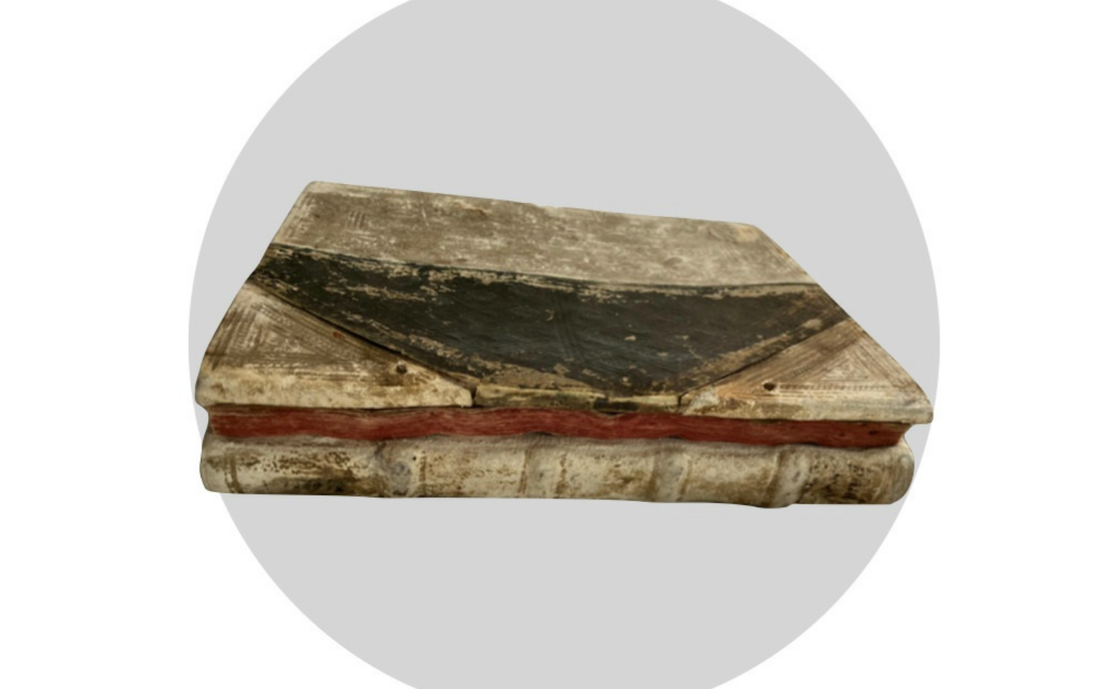
Inez van der Werf (RCE) over proteïne-analyse in lerenboekbanden op het veertigjarig jubileumcongres in Nijmegen, 22 november 2024.